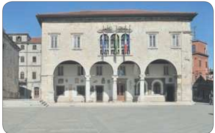
Gradska vijećnica Pula