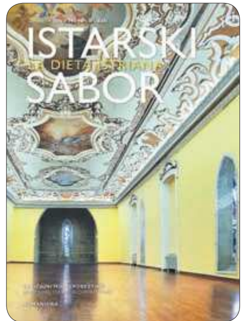
Interijer Istarske sabornice na naslovnici knjige

Djelo je vrlo detaljno, temeljito, gdje autori s raznih gledišta razmatraju određene povijesne fenomene vezane za to razdoblje nudeći interdisciplinarnu studiju uz obilje podataka te fotografskih zapisa