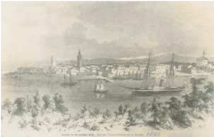
Zgrada pokrajinskog odbora u Poreču i nekadašnja crkva sv. Franje, s početka 20. stoljeća