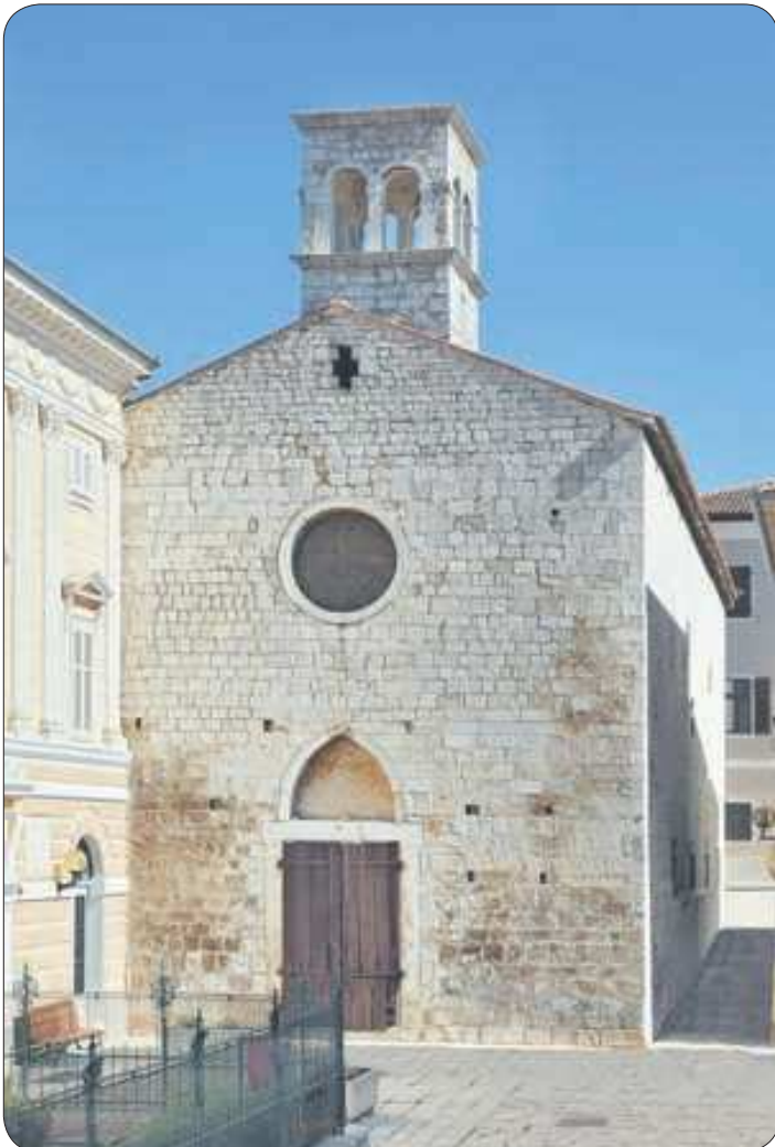
Istarska sabornica u Poreču

ma djelovanja temeljito i detaljno tematizira Elena Poropat.