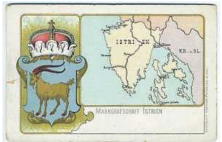
Markgrofovija Istra, razglednica