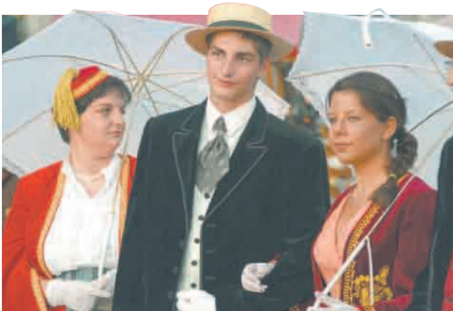
... ali i plemića i plemkinja