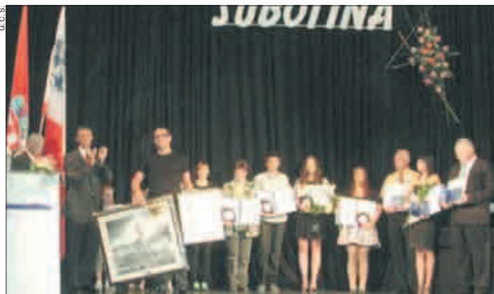
Sa svečane sjednice vijeća - dobitnici gradskih priznanja

- Konstanta u ovim turbulentnim vremenima jesu socijalna osjetljivost, ulaganje u društve-